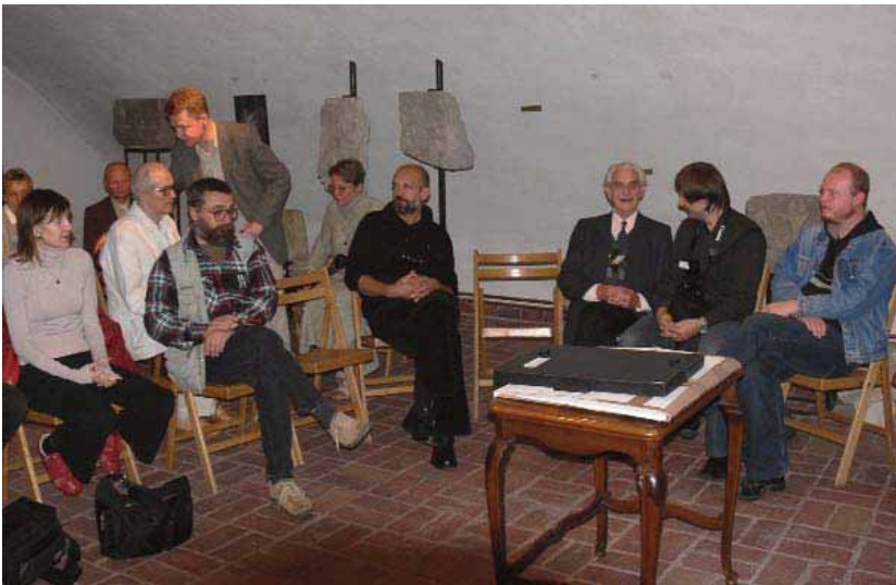
Chojnów 14.09.2007